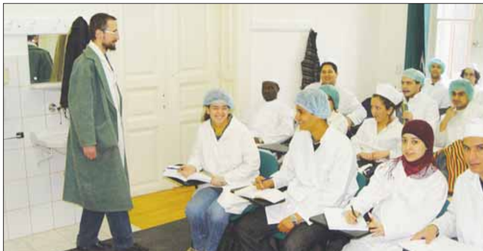
În general, cel mai mari taxe de studiu sunt percepute la universitățile de medicină și farmacie

Studenții de la cele patru universități de stat clujene care au participat la studiu declară că au venituri lunare între 300 și 500 lei și sub 10% din studenții de la Medicină, de la Universitatea