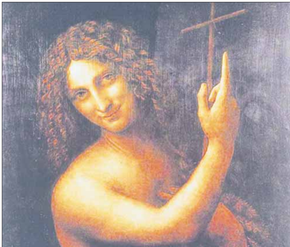
Cercetătorii italieni sunt de părere că modelul folosit atât în pictura „Ioan Botezătorul”, cât și în „Mona Lisa”, este unul și același - Salai, ucenicul lui Leonardo da Vinci