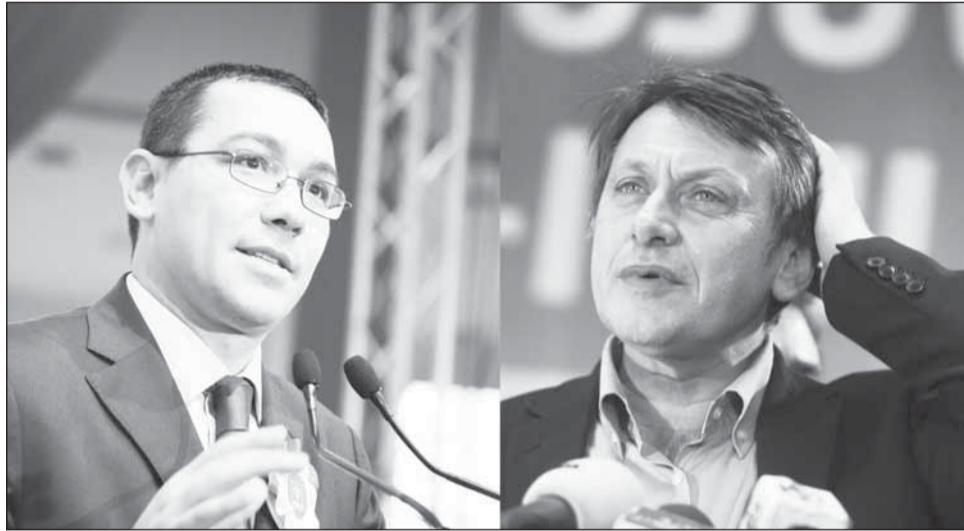
Victor Ponta și Crin Antonescu "au bătut palma" pentru o alianță de nouă ani

PSD, PNL și PC au încheiat protocolul Uniunii după mai bine de două luni de discuții, delegațiile permanente ale celor trei partide au aprobat, la finele săptămânii trecute înființarea USL. Victor Ponta a declarat că odată cu realizarea Uniunii Social Liberale, părțile au răspuns la întrebarea pe care o pun românii: "Ce faceți ca să ne scăpați de Traian Băsescu, Emil Boc, Elena Udrea?". "Iată ce facem, noi astăzi ne unim", a răspuns Ponta. Și președintele PC a declarat că "astăzi