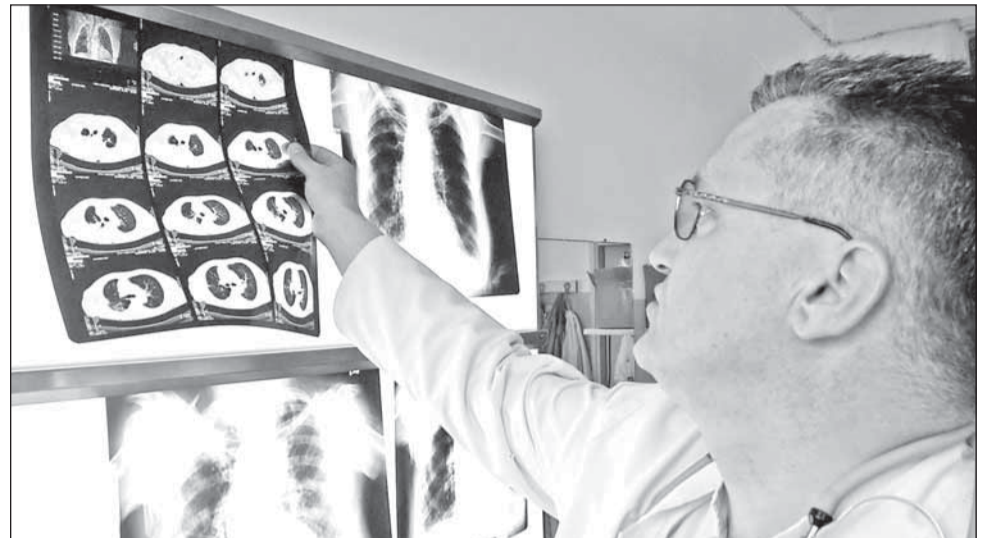
Deși la nivel național incidența tuberculozei este foarte ridicată, statisticile arată că în Cluj situația nu e atât de gravă

Incidența tuberculozei în țara noastră ar putea să scadă în următorii ani ca urmare a unei inițiative a Parlamentului European prin care această boală ar urma să fie inclusă într-o strategie prin care se vizează încetarea creșterii numărului de îmbolnăviri. Astfel, ar urma