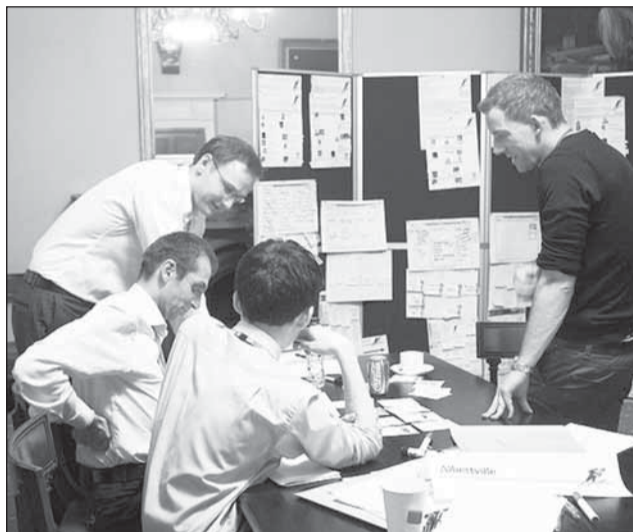
Românii care au emigrat pentru a lucra în domeniul IT au câștigat circa 5.000 de euro pe lună

Cele mai bine plătite domenii au fost cele care necesitau studii de specialitate: „petrol și gaze” (minim 3.500 euro/lună), „farmacie” (3.500-4.000 euro/lună), „IT”, „personal medical și sanitar” și „inginerie” (până la 5.000-5.800 euro/lună). Potrivit reprezentanților Tjobs, salarii tentante au fost propuse și